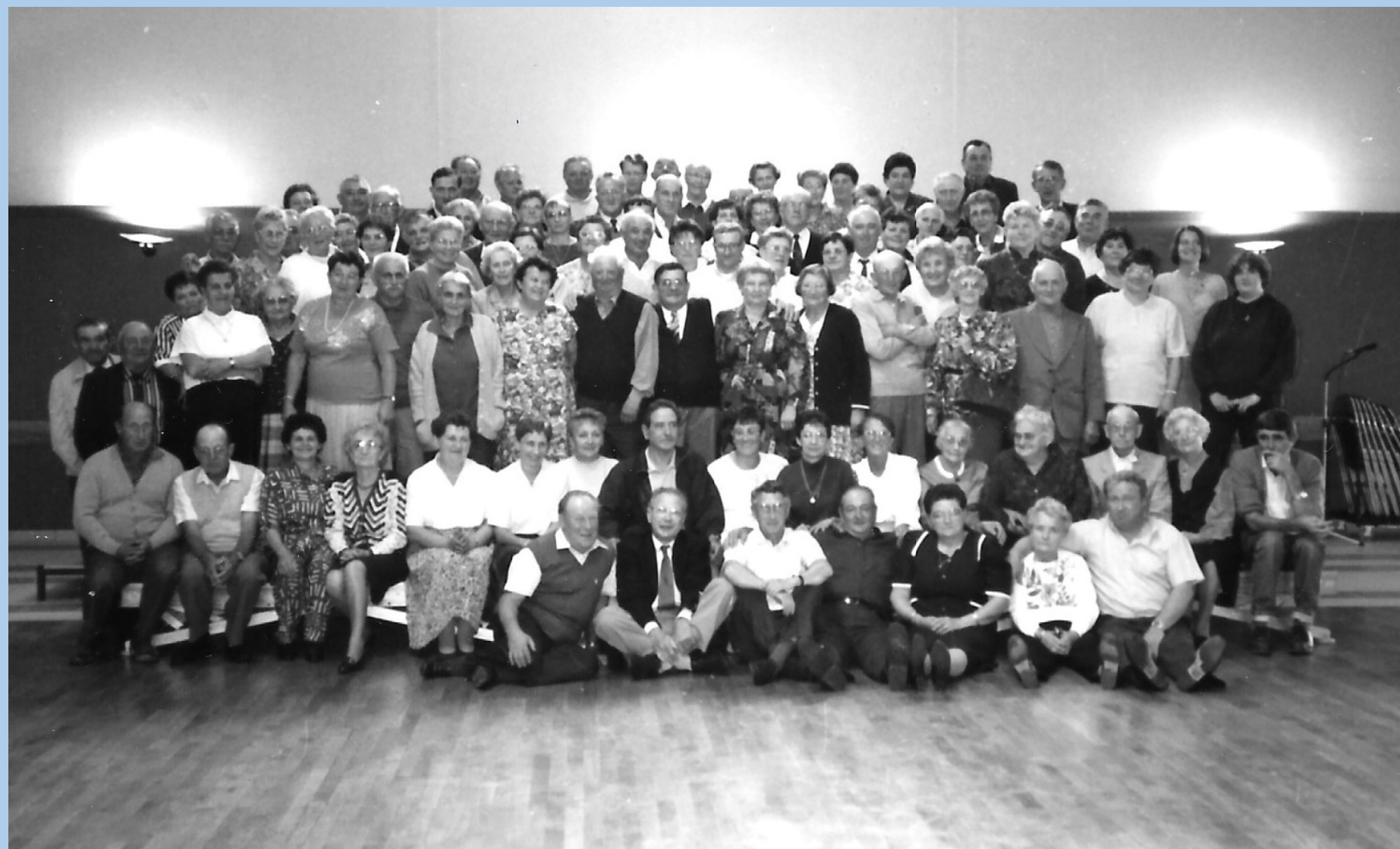
1993 à Beaumont